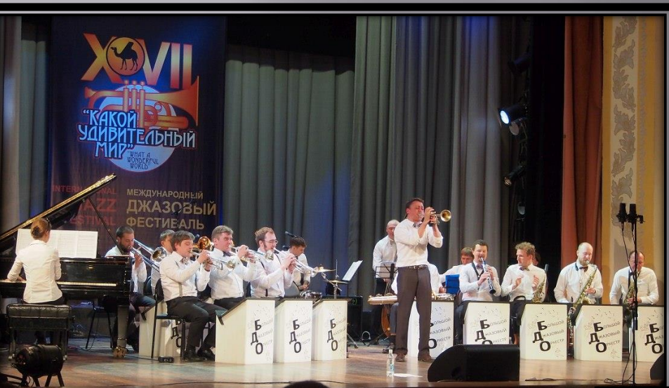
Инструменты эстрадного оркестра