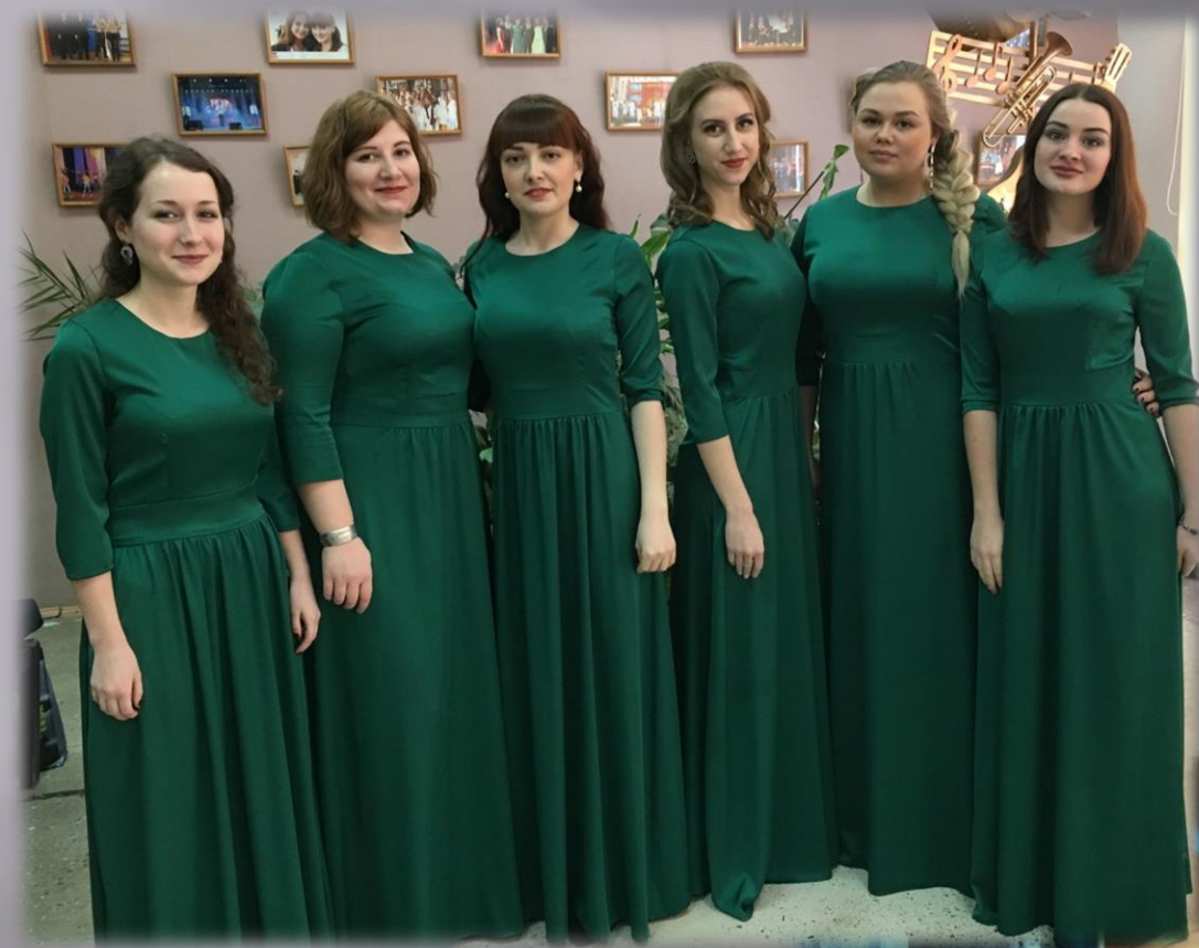
Вокальный ансамбль кафедры на Международном конкурсе в Туле