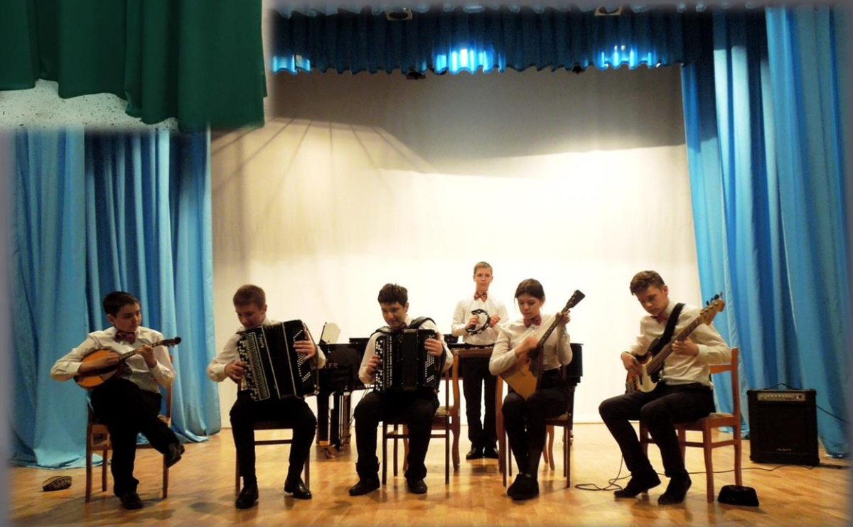
Международный конкурс инструментальных ансамблей