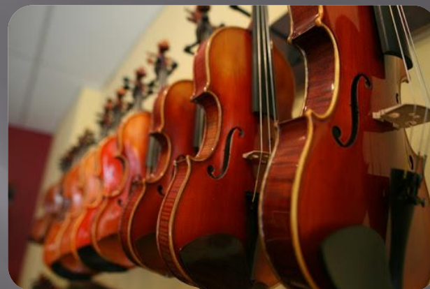
Оркестровые струнные инструменты