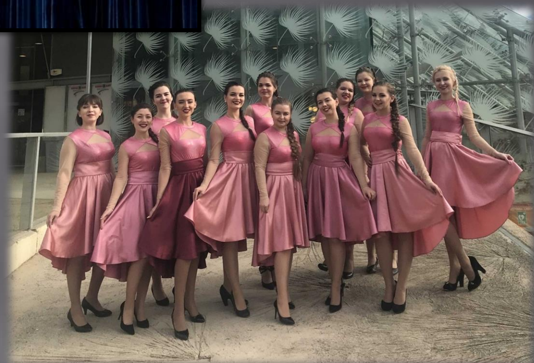
Вокальный ансамбль «Субтон» на Международном конкурсе в Испании